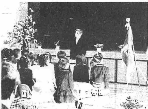
池田小学校の入学式の様子

池田町には池田町教育センター(昭和60年設置)があり、池田町全体の学校教育の向上のために防災・保健・コンピュータ活用など15の委員会(研究会)が調査・研究・実践活動に取り組んでいます。今年度は特に、特別支援教育・福祉教育・教育相談研究の充実に向け、豊かな心を育むとともに、いじめ・不登校問題に取り組んでいきます。