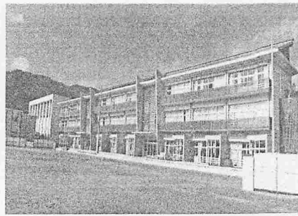
八幡小学校 新校舎の外観

こうして新たな歴史を刻み始めた八幡小学校ですが、学校は「校舎が竣工すれば完成」ではありません。実際に使いはじめれば、いくつかの手直しもあるでしょう。何よりもこれまでとは異なる環境を、如何に使いこなし、学校に関わる様々な人達のためにどう生かしていくか、それを常に考え続けることが重要だと思っております。これから、新しい八幡小学校を創っていく皆さんと一緒に考えていきたいと思います。