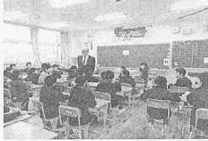
岡崎町長 八幡小新校舎訪問（1月8日）