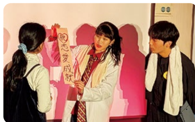
「恋を呼ぶ温泉」のシーン

また、今後私たちだけでなく、全国の各部活動でも、自分たちの得意分野と地域を掛け合わせ、高校生が企画を行い、楽しいイベントで地域を盛り上げていってほしいと思います。今後ともチームBraDraをよろしくお願いします。