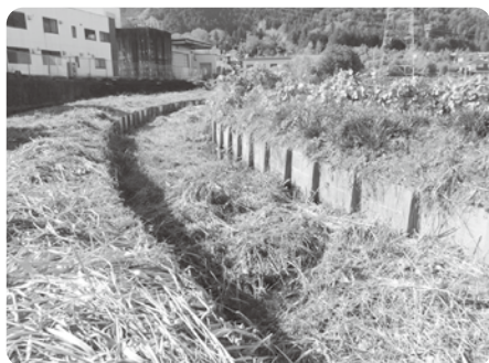
浚渫が待たれる東光寺谷

東光寺谷の草刈りを地元住民が毎年行っている。葦類が繁茂し、根で川底が盛り上がり流下能力が低下。 また、作業者も高齢化し足場も悪い中、事故等も心配される。谷の浚渫と底のコンクリ張り、堤防の改修を望む。