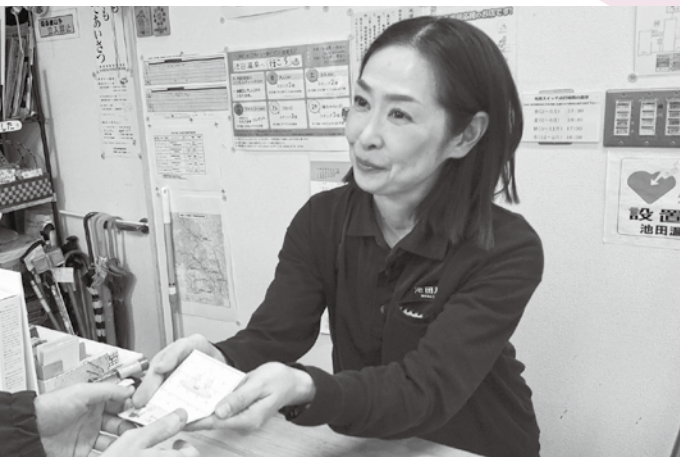
★丁寧で気持ちの良い接客