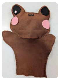
「福ちゃん」の パペット人形も作成

私たちはこれからも「池田温泉×演劇」で地域を盛り上げ、温泉と演劇を楽しめる場所にしていきます。