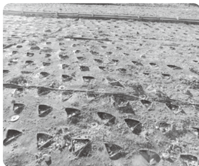
欠株が目立つ花畑

より実施予定。河床のコンクリ張りは、管理者である損斐土木事務所と協議・検討する。