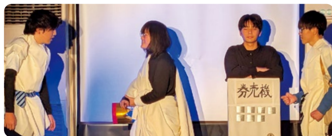
「入れメロス」のシーン

しかし、事前アンケートを行い、演劇に関わったことがない方でも興味があることが分かり、実際に池田温泉公演をやると決めてからは、池田町内全ての小中学校にも伺って、放送で宣伝するなど広報活動にも力を入れました。その甲斐もあり、当日は家族連れをはじめたくさん訪れていただき、地域の方と高校生の絆も深まりました。