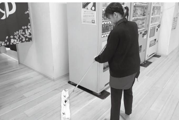
★目が行き届いた清掃