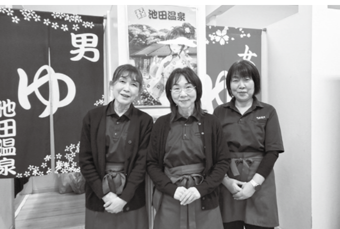
★最高の笑顔でおもてなし