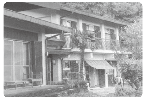
霞間ヶ溪さくら会館

建物の解体設計だけでなく、文化保護法手続の調整、しだれ桜等を保護するための調査設計、アスベスト含有建材調査、土壌調査、実施設計図作成などが含まれた金額である。