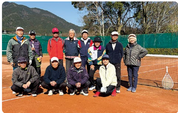
コートにてメンバーと