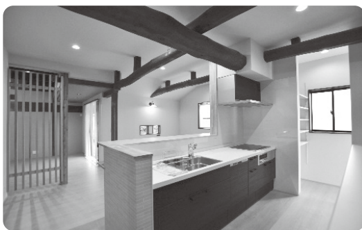
生まれ変わる空き家