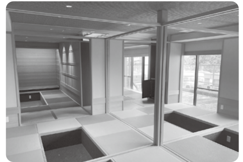
現状の池田温泉新館2階